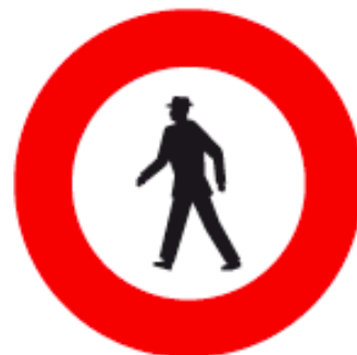
Accès interdit aux piétons Figure 2.15 de l'OSR

De Plus, les indications suivantes devront accompagner les panneaux ci-dessus, soit :