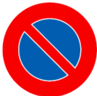
Interdiction de stationner Figure 2.50 de l'OSR